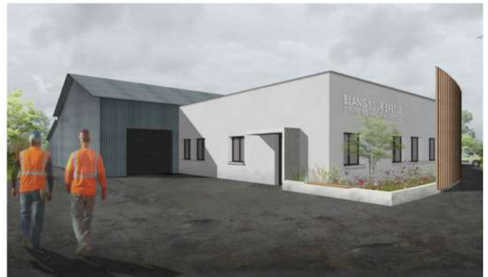
Maquette du futur centre technique municipal.

Le budget 2023 a été voté à l'unanimité.