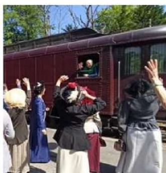
Rétrospective 2022 - p. 5