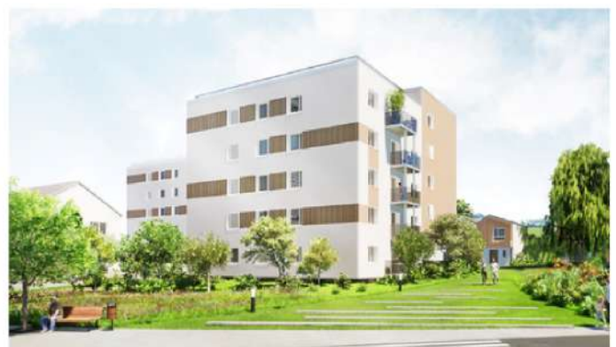
Projection des futurs logements du Camp Comtois.