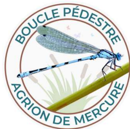
Logo de la boucle pédestre Agrion de Mercure.