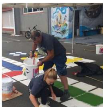
Budget 2023 - p. 8