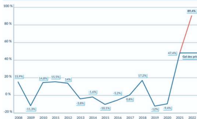
Évolution des tarifs réglementés du gaz de 2008 à 2022

Source : Commission de Régulation de l'énergie, évolutions annuelles du tarif réglementé du gaz hors taxes (HT)