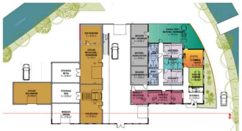
Plan intérieur du futur centre technique municipal.

Les travaux débuteront en 2023 et se termineront en 2024.